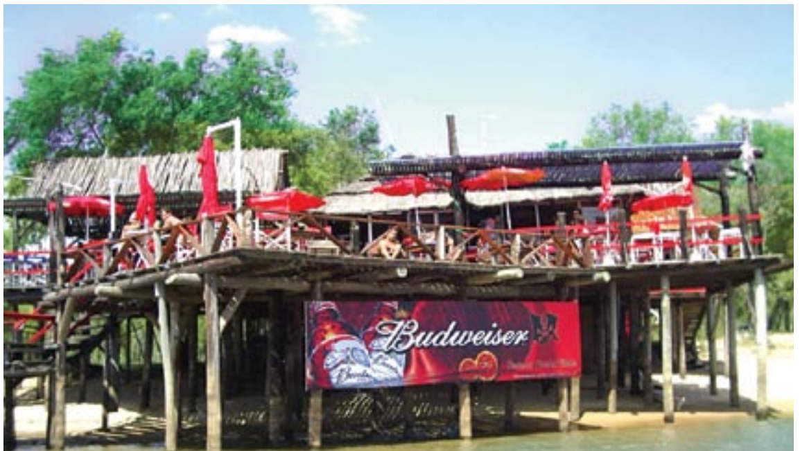
PARADOR PUERTO PIRATA ROSARIO

Proponen un punto de reunión donde la música, la infraestructura y los deportes son los condimentos necesarios para pasar un buen momento. Desde embarcaderos para la práctica de deportes náuticos, los mejores deejays, la presencia de nuestras Más Lindas, hasta terrazas al aire libre para disfrutar el entorno.