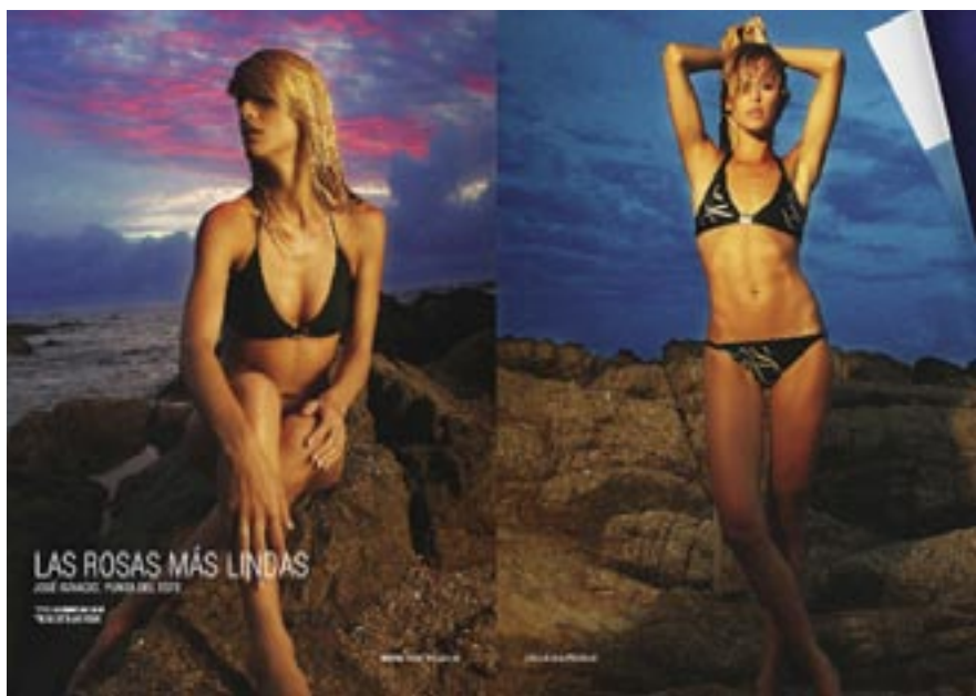
LAS ROSAS MÁS LINDAS: una de nuestras secciones estrella, iluminada por la belleza de las chicas y la alta calidad artística que caracteriza a las producciones.