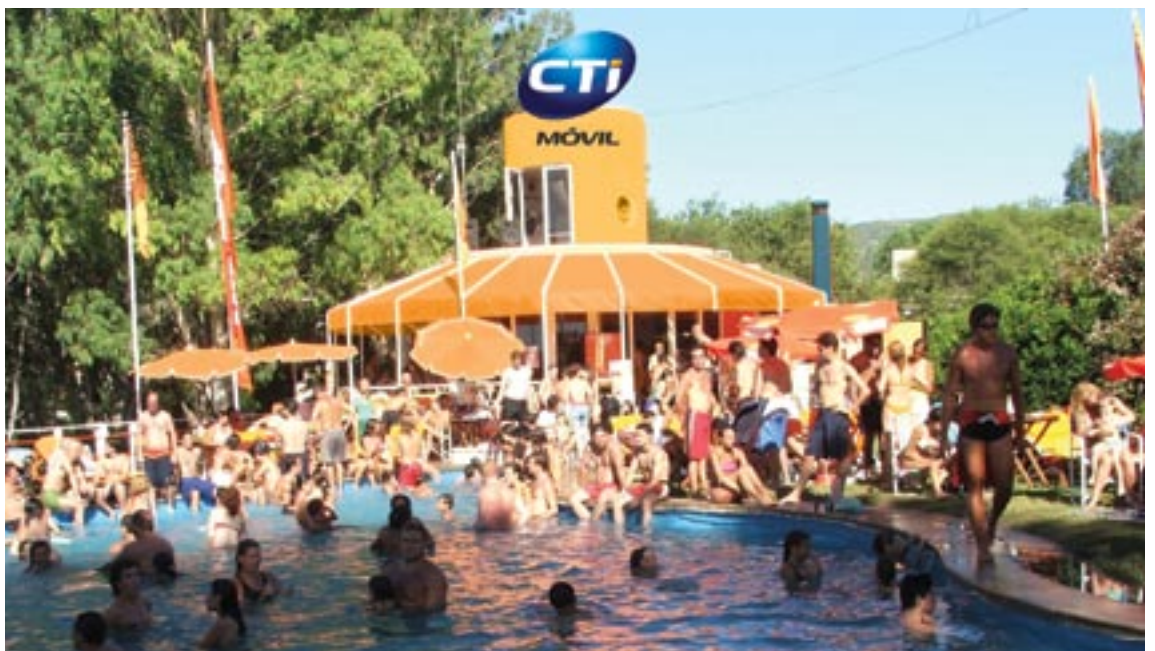
PARADOR AMARRAS CARLOS PAZ