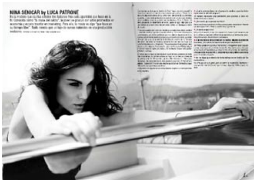
PROFILE: una nota para conocer en profundidad a la modelo que ilustra nuestra tapa: sus gustos, su historia, sus sueños y esos pequeños detalles que la hacen tan particular.