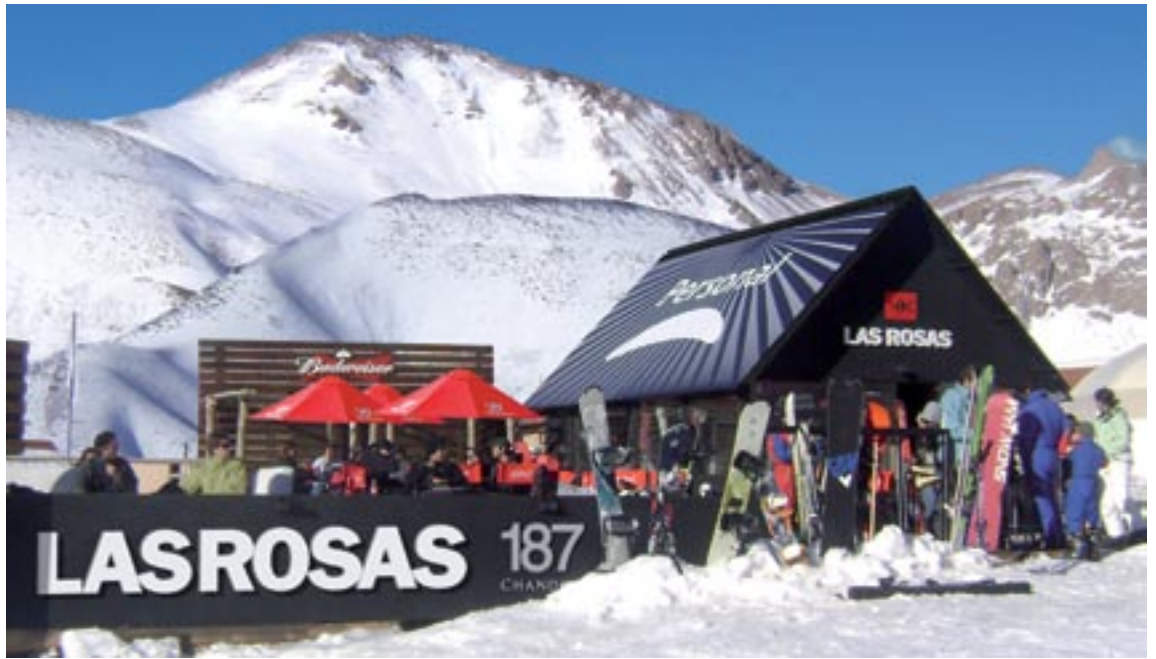
PARADOR LAS ROSAS LAS LEÑAS