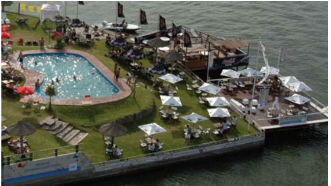
PARADOR LAS ROSAS CARLOS PAZ