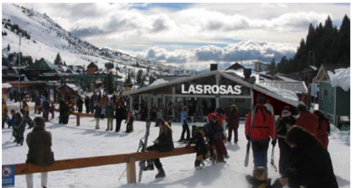
PARADOR LAS ROSAS BARILOCHE